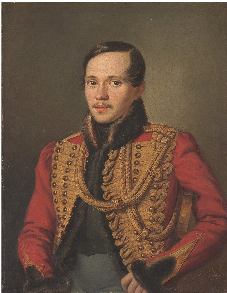
Михаил Лермонтов. 1837. Худ. П.Е. Заболотский.